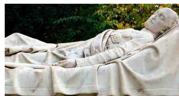
Λεωνίδα Δρόση, Μνημείο Αλέξανδρου Υψηλάντη, π. 1869, μάρμαρο, Πεδίον του Άρεως

Η ευγενέστερη και ποιητικότερη μορφή του ελληνικού επαναστατικού αγώνα πέθανε από υδρωψία του στήθους και του καρδιακού θυλακίου, άγαμη, στο πανδοχείο An der goldenen Birne (Στη Χρυσή Αχλαδιά) της Βιέννης στις 19/31 Ιανουαρίου 1828, μέρα σημαδιακή για την αναγνώριση της αυτονομίας της χώρας μας και τον ρόλο σε αυτήν του Ιωάννη Καποδίστρια. Ενταφιάστηκε στις 2 Φεβρουαρίου 1828, αρχικά στο καθολικό τμήμα του νεκροταφείου Sankt Marx, νοτιοανατολικά της Βιέν-