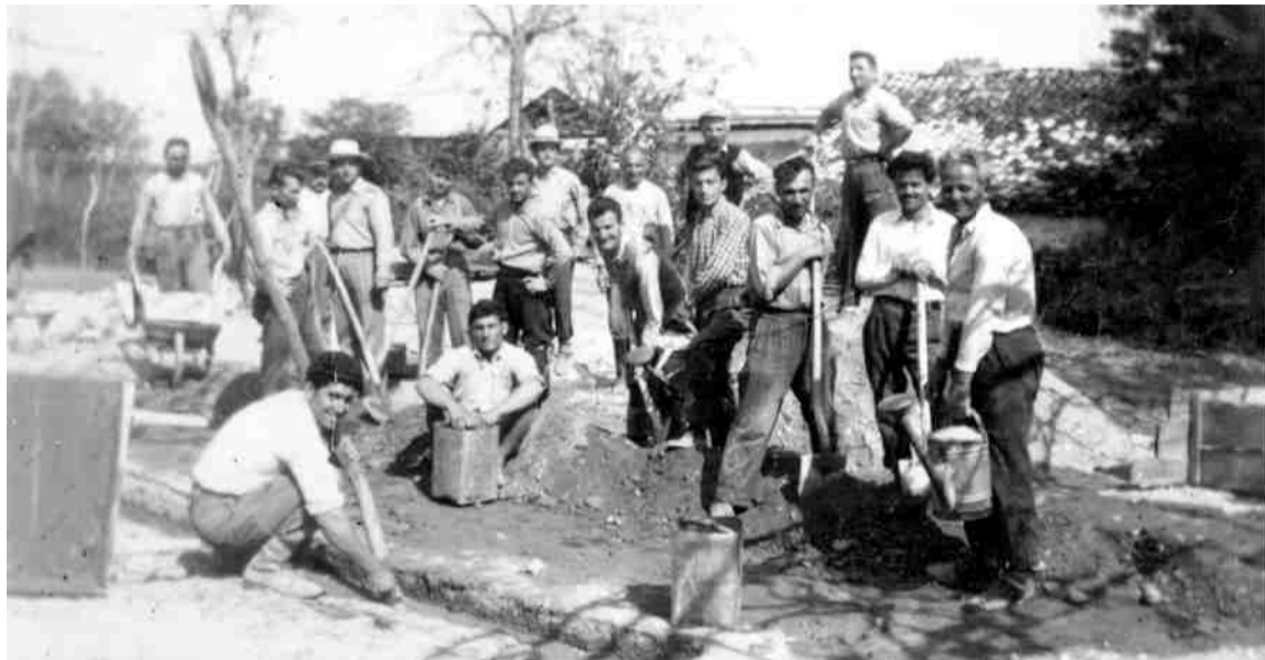
Θεμελίωση σπιτιού με προσωπική εργασία από τους κατοίκους του χωριού στην αρχή της δεκαετίας του 1950.